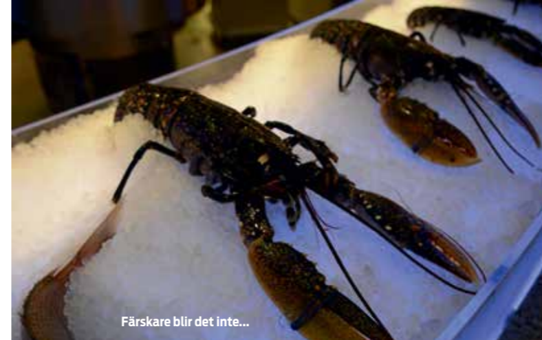
Färskare blir det inte...