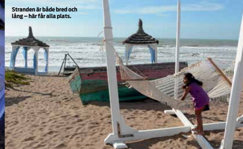
Stranden är både bred och lång – här får alla plats.