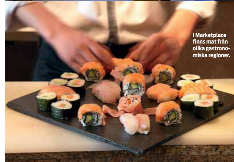
I Marketplace finns mat från olika gastronomiska regioner.