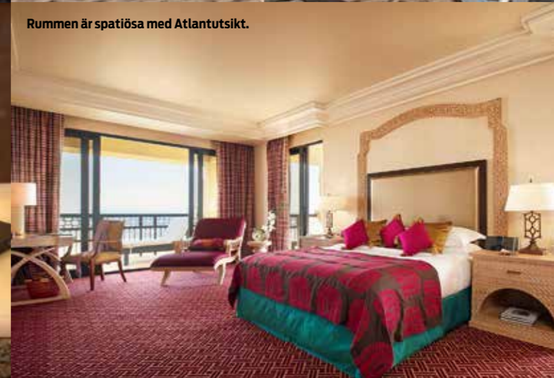
Rummen är spaciösa med Atlantutsikt.