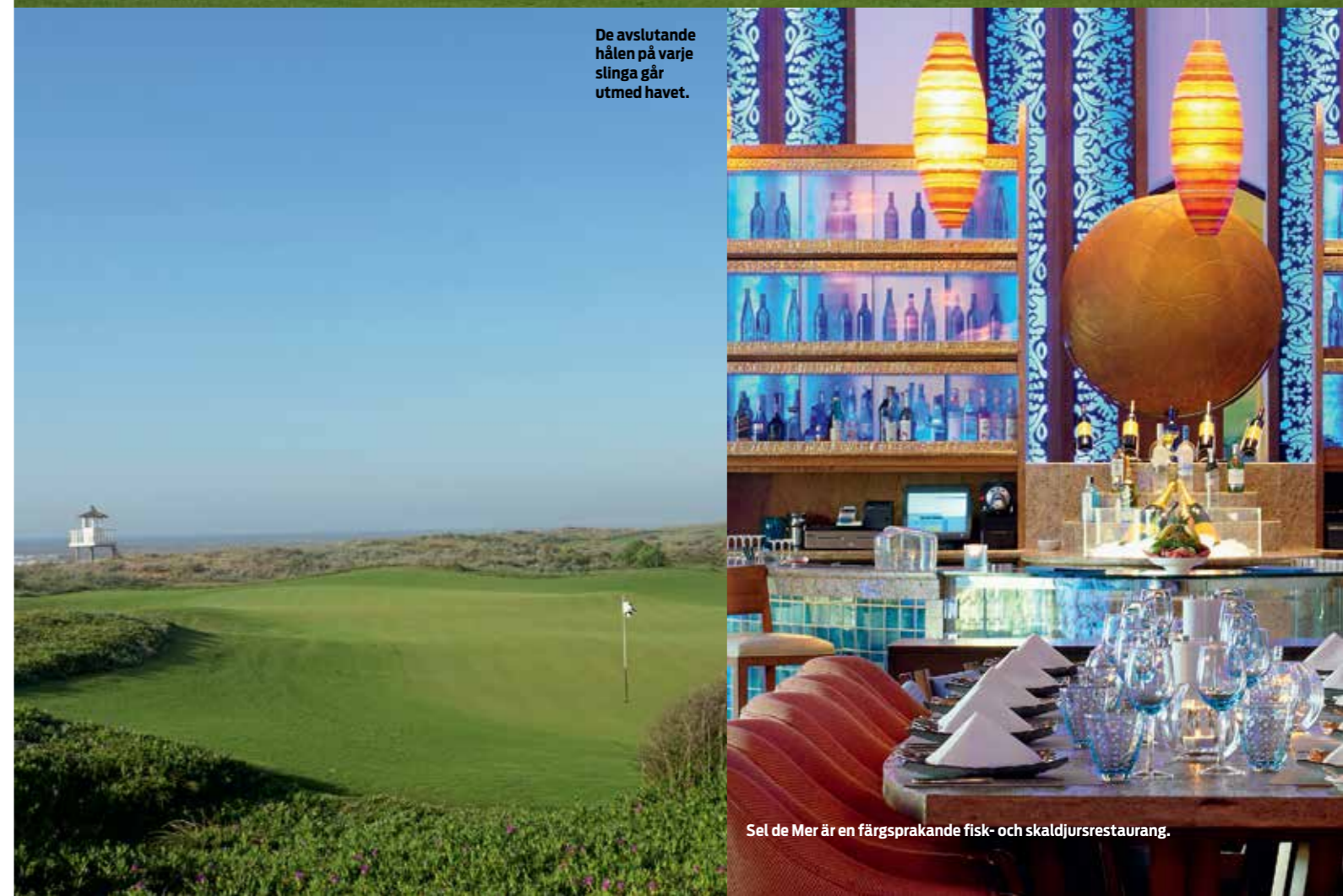
De avslutande hålen på varje slinga går utmed havet.