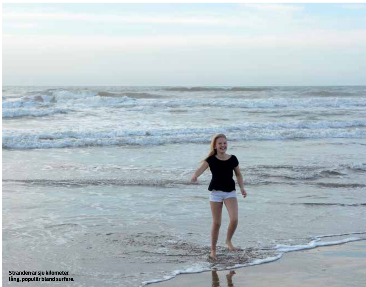
Stranden är sju kilometer lång, populär bland surfare.