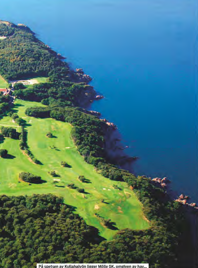
På spetsen av Kullahalvön ligger Mölle GK, omgiven av hav...